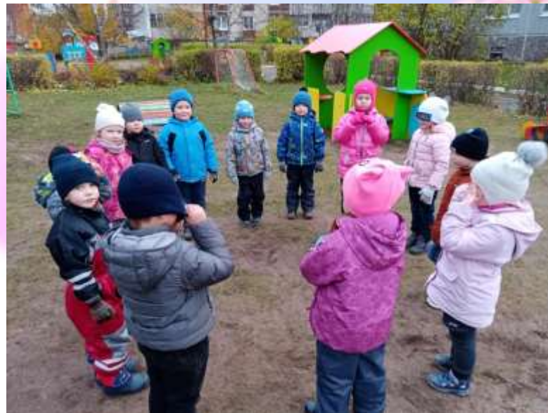
Подвижные игры на прогулке